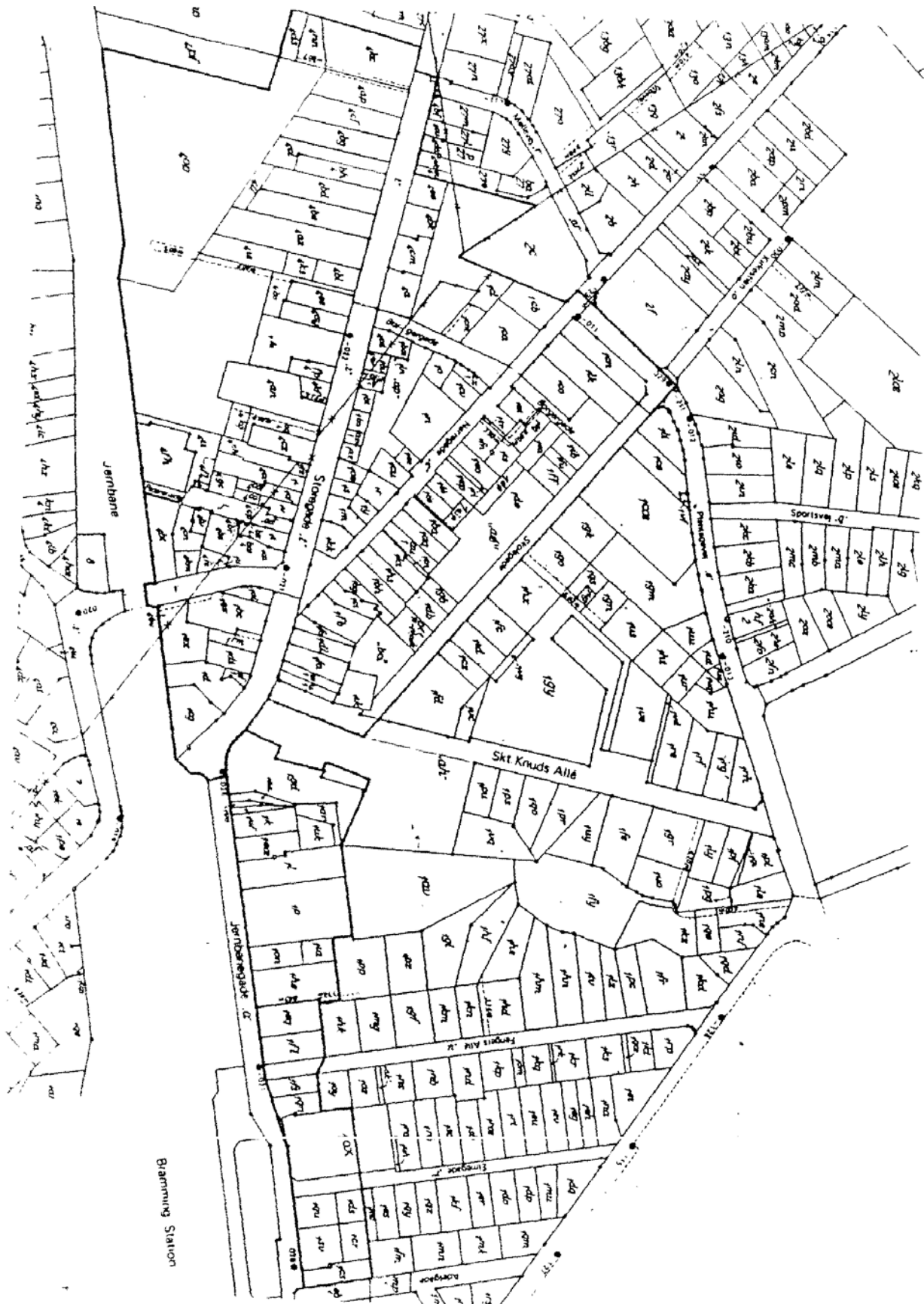
KORT 2 Bramming bymidte Mål 1:4000