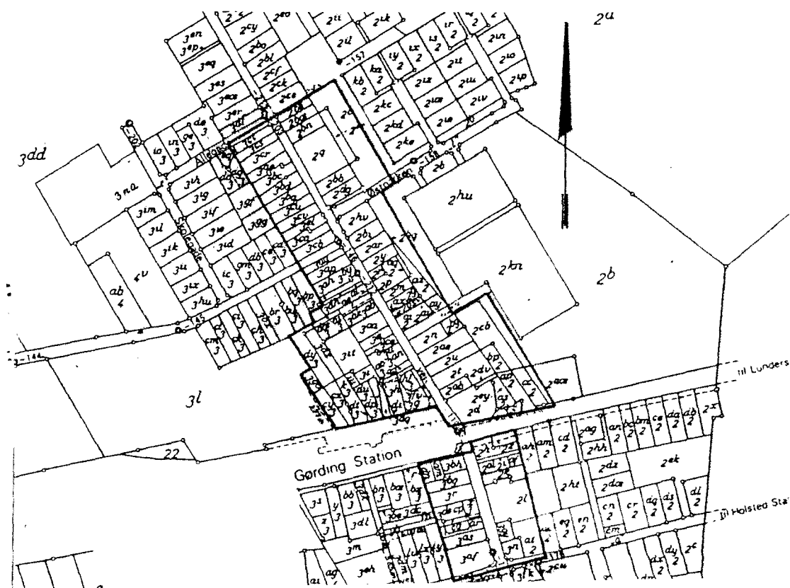
KORT 1 Gørding bymidte Mål 1:4000

Stk. 1. Følgende retningslinjer og bestemmelser gælder for områderne vist på kort 1 og 2.